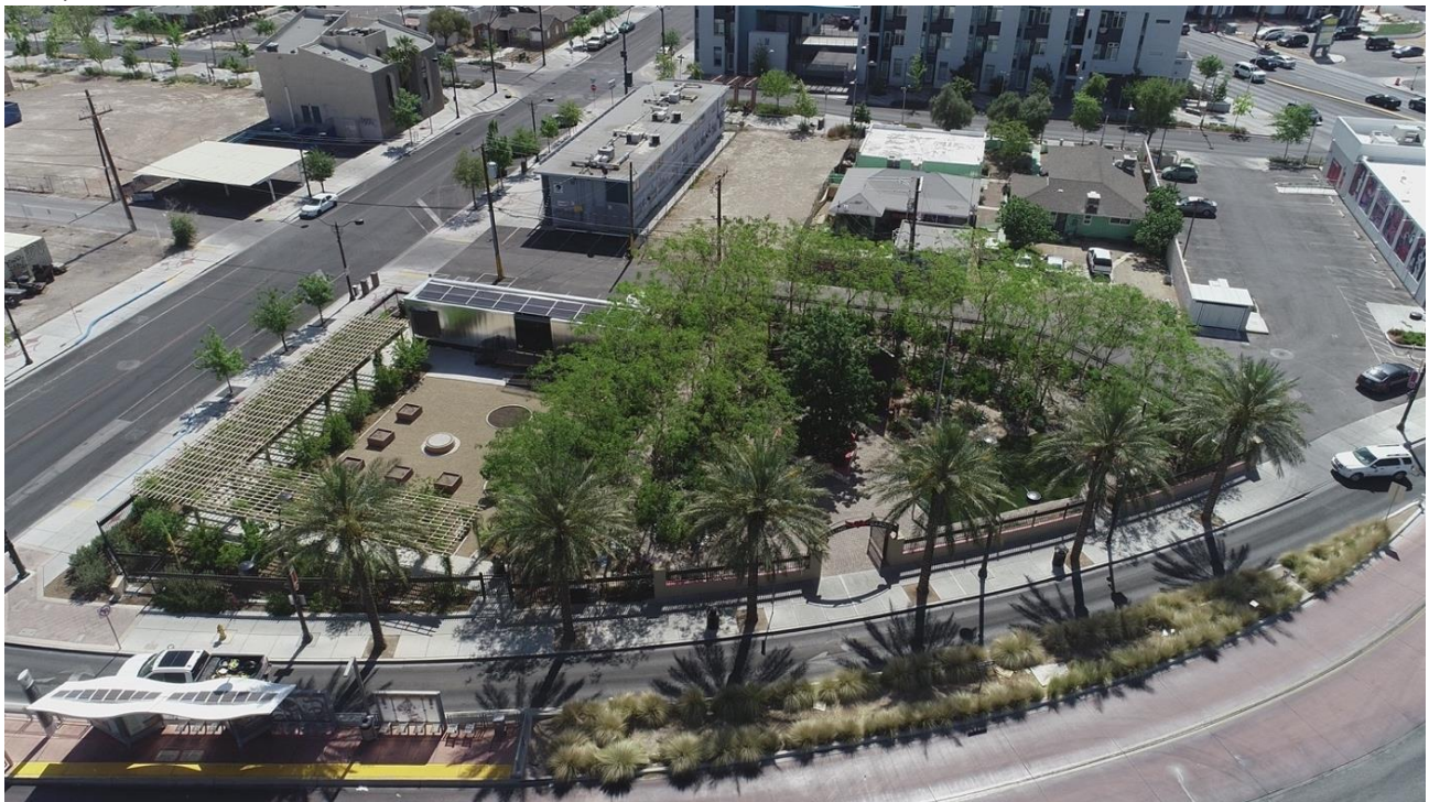
Jardín de Sanación de la Comunidad de Las Vegas, 2022