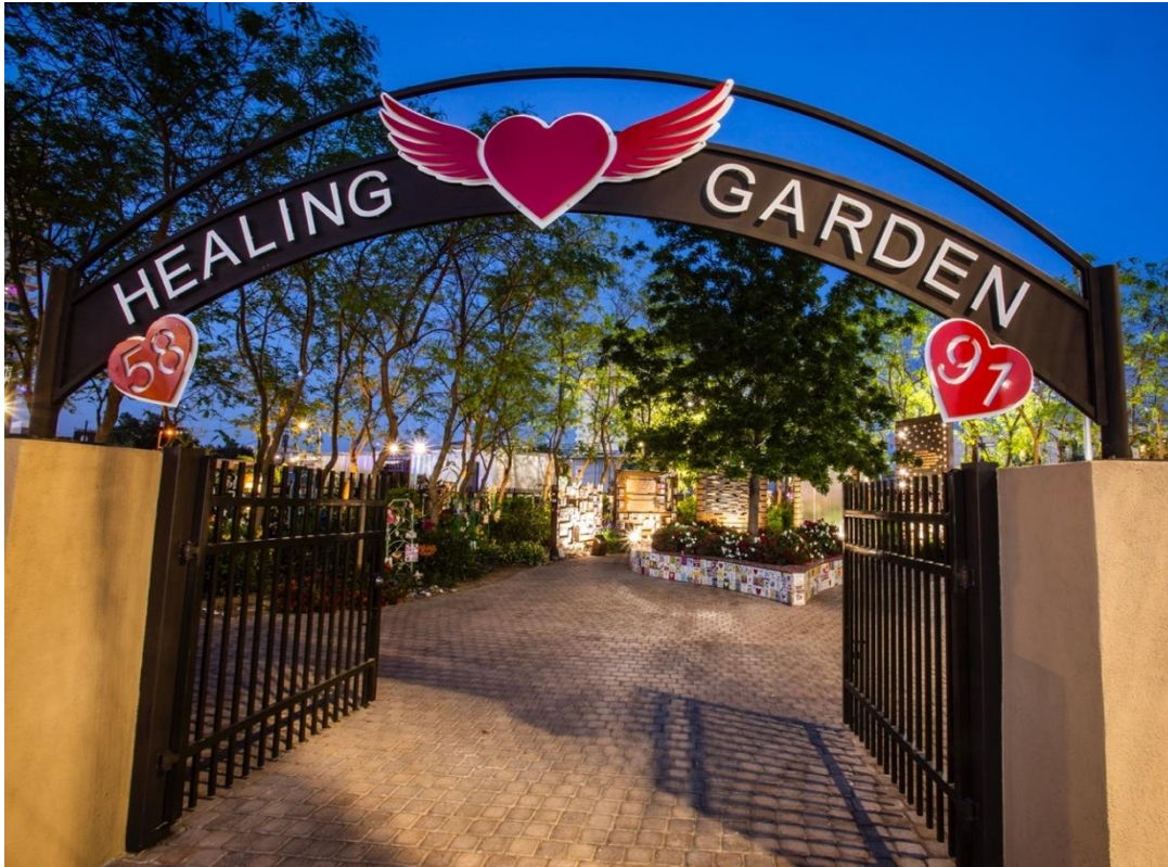
El 6 de octubre de 2017, el Jardín de Sanación de la Comunidad de Las Vegas se dedicó y abrió al público. Cincuenta y ocho árboles, uno para cada víctima, rodean un roble gigante llamado Árbol de la Vida, 2022