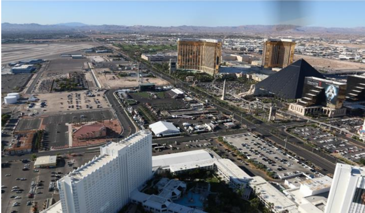
Descripción general de la escena