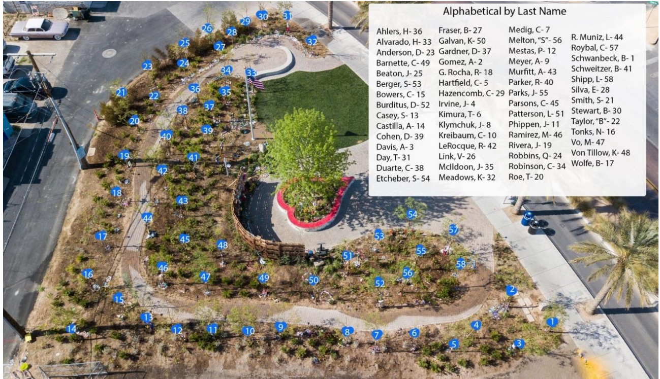
Jardín de Sanación de la Comunidad de Las Vegas Mapa original de árboles, 2017