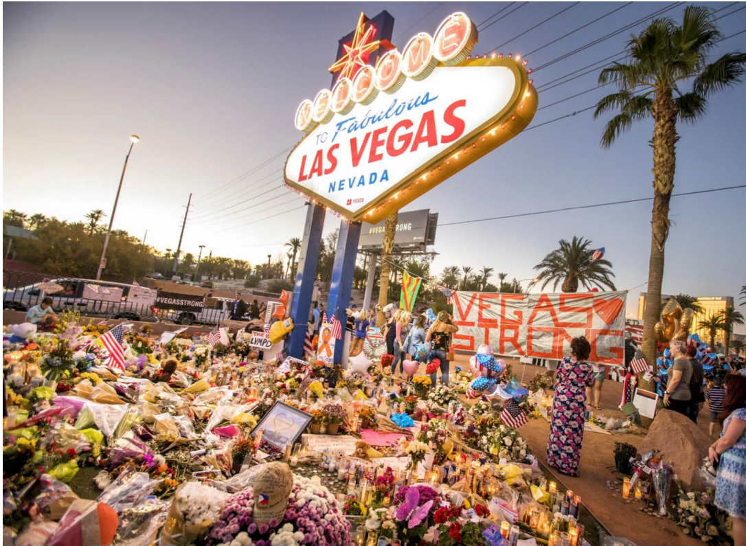
Ejemplo de conmemoración espontánea, 2017