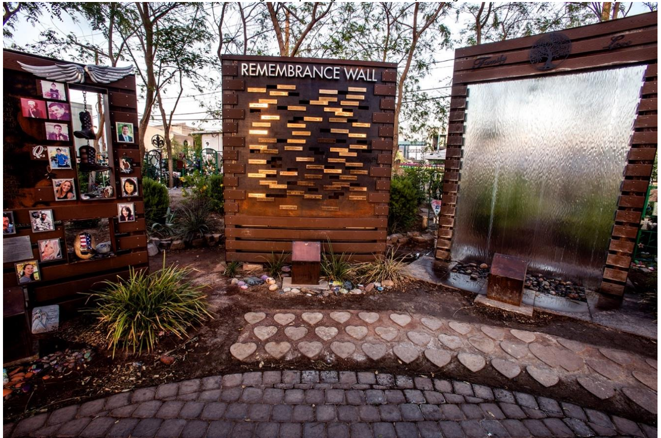
Muro del Recuerdo en el Jardín de Sanación de la Comunidad de Las Vegas, 2022